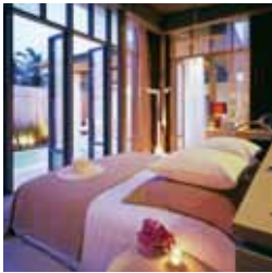
푸켓 사라 풀빌라